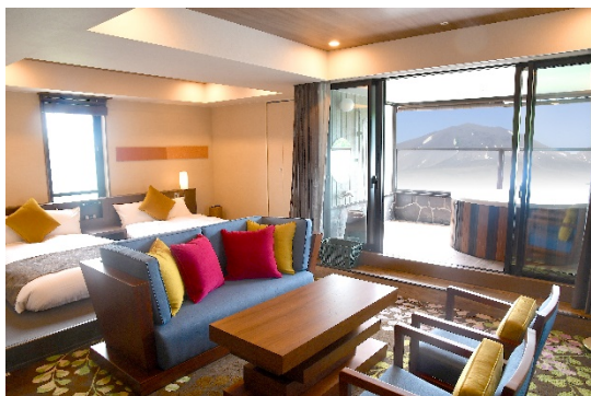
軽井沢倶楽部ホテル軽井沢 1130(客室)

ホテルヒューイット甲子園、軽井沢倶楽部ホテル軽井沢 1130、クインテッサホテル札幌、クインテッサホテル佐世保、ザ エディスターホテル成田、クインテッサホテル伊勢志摩、クインテッサホテル大垣、クインテッサホテル大阪心斎橋、クインテッサホテル大阪ベイ、ザ エディスターホテル京都二条、クインテッサホテル東京銀座、クインテッサホテル福岡天神南 (全 12 ホテル)