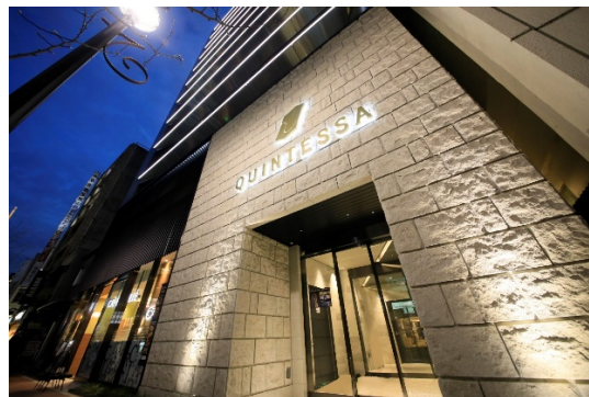
クインテッサホテル東京銀座(外観)